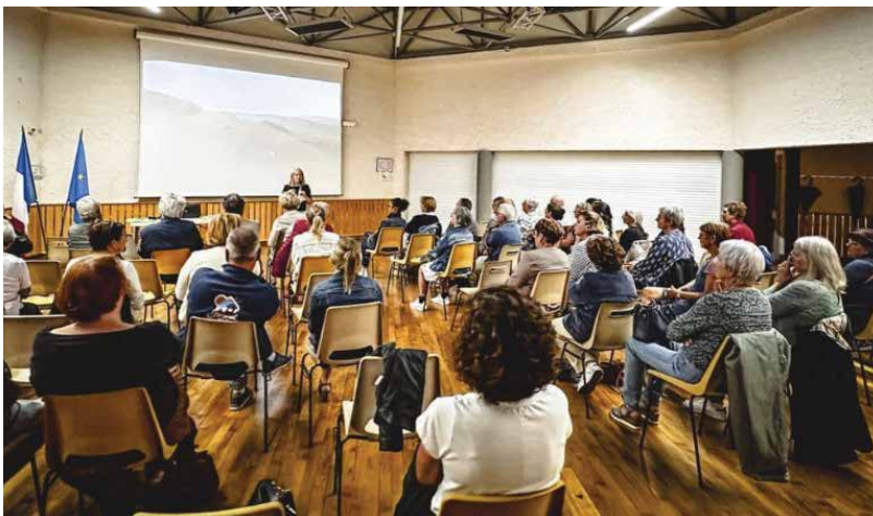
Les rangs de la salle Jean-Claude étaient bien remplis

Elle a choisi notre commune Choisey pour sa rencontre du 21 septembre. Après quelques propos introductifs, le film « Mourir n'est pas tuer » a été projeté.