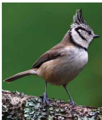
La Mésange huppée

Sans vraiment de surprise, le moineau domestique est l'espèce la plus observée, avec 346 oiseaux, suivi par la Mésange charbonnière et la Tourterelle turque.