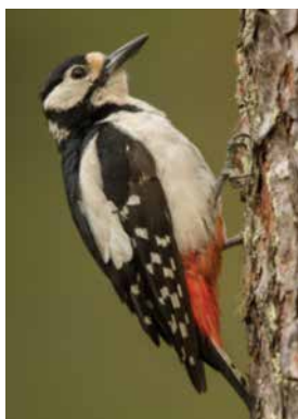
Le Pic épeiche

Côté espèces, la Mésange charbonnière, suivie du Rouge-gorge familier, reste en tête entre 2013 et 2022. Étonnamment, ces deux espèces ne figurent pas dans les plus observées à Choisey, mais sont cependant présentes dans le TOP 10.